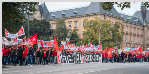
Küstenaktionstag der Geschäftsstelle Hamburg