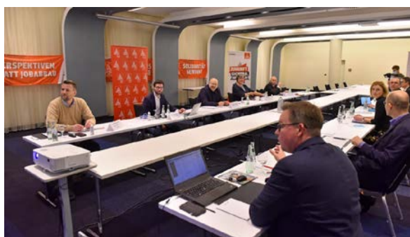
Corona-bedingt kamen wir mit Nordmetall in kleiner Runde zusammen.

Die Verhandlungen werden am 18. Januar 2021 fortgesetzt.